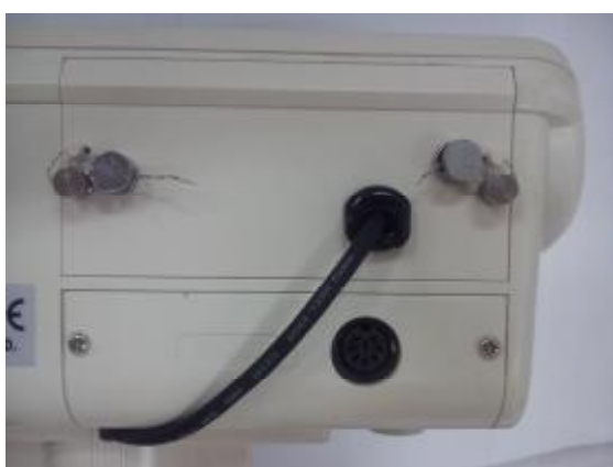
Рисунок 2 – Место пломбировки весов

Знак поверки в виде наклейки наносится на лицевую панель индикатора. Схема пломбировки от несанкционированного доступа приведена на рисунке 2.